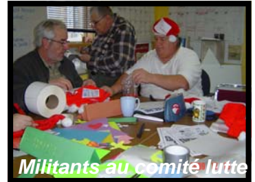
Militants au comité lutte

Lors du comité lutte de l'ADDS, le 10 décembre, nous nous sommes préparé pour la manifestation du 11 décembre. Nous avons préparé nos pancartes, avec des messages à dire au ministre. Aussi, étant donné le froid, nous avons écrit des messages sur des tuques, afin de nous garder au chaud!