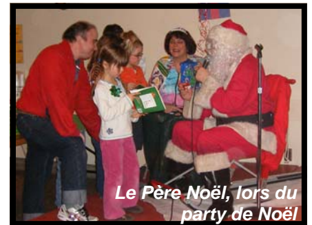
Le Père Noël, lors du party de Noël

Plusieurs militantes et militants étaient présents au légendaire party de Noël du 301 Carillon. Souper traditionnel, musique, danse et performances impressionnantes au jeu de La Fureur étaient au rendez-vous! Bravo! Beaucoup de plaisir était à l'honneur.