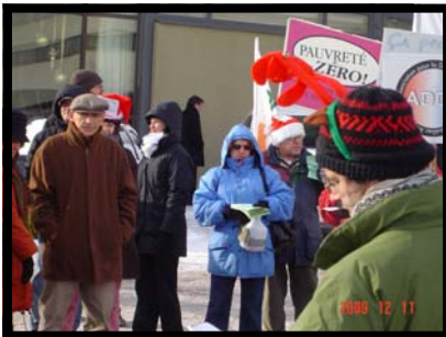
ManifestantEs, lors du rendez-vous de la solidarité, à Québec