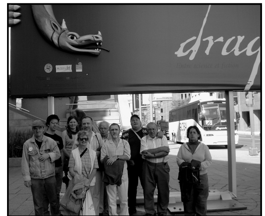
Des militantEs de l'ADDS à l'entrée du Musée de la Civilisation.

C'est maintenant une tradition ! À chaque année, en revenant de vacances, l'ADDS organise une sortie de la rentrée avec les militantEs activement impliqués dans le groupe. C'est une manière de se retrouver et de répartir l'année militante du bon pied ! C'est ainsi que le 21 septembre dernier, douze militantEs sont allés s'instruire au Musée de la Civilisation ! Le tout s'est terminé autour d'un bon repas au restaurant.