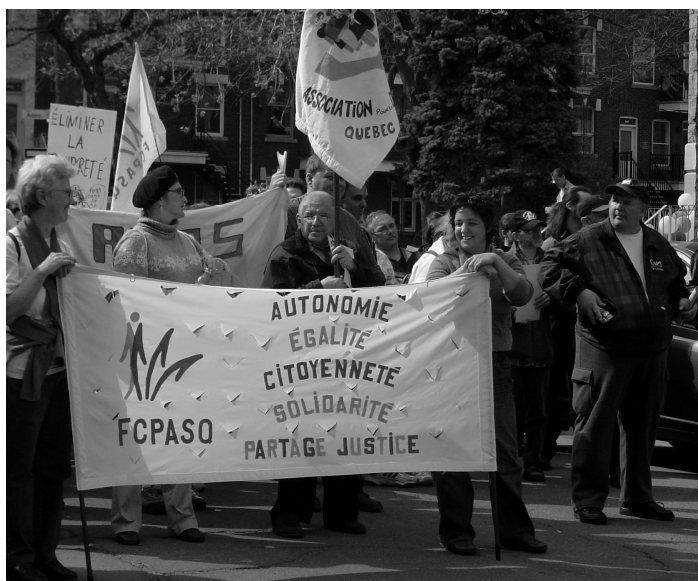
Manifestation du FCPASQ lors de la Semaine de la Dignité en 2006.

réouvert les yeux et je me suis dit qu'il faut en parler à mes amis et amies de l'ADDS. Je vous conseille de prendre le temps de l'ouvrir. Vous ne serez pas déçu car vous allez connaître une belle histoire et apprendre que du monde ont travaillé fort pour avoir ce que l'on a. Je ne vous en dis pas plus, allez découvrir ! Moi, Robert (J'AI DIT).