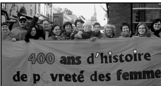
Des R♀F en action !

Le 15 octobre, vingt membres de l'ADDS ont participé à une importante rencontre... En effet, c'était l'assemblée générale d'orientation ! Durant cette assemblée, les membres ont adopté le bilan des activités 2007-2008 et le plan d'action pour l'année 2008-2009. Bravo aux personnes présentes ! C'est en s'organisant que nous pouvons améliorer nos conditions de vie !