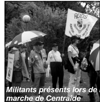
Militants présents lors de marche de Centraide

Centraide a fait le lancement de sa campagne annuelle. Le lancement a eu lieu le 15 septembre dernier. Une marche a précédé la rencontre. Les militantes et militants de l'ADDS étaient présents. Ils en ont profité pour faire signer la pétition sur l'abolition des catégories.